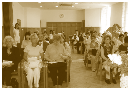
Kedves és aktív hallgatóság