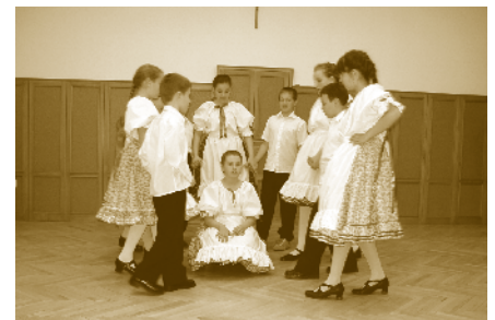
Gyermek néptánc program