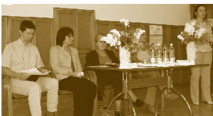
Meghívott vendégeink: Baranya Megyei Egészség Pénztár, regionális ÁNTSZ és be- teggji képviselőnk